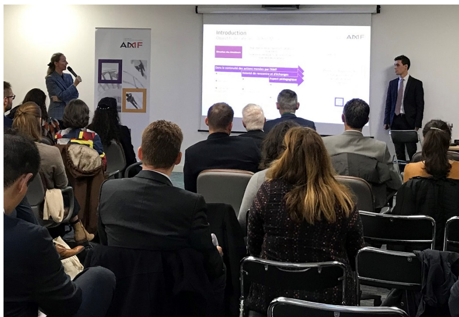
Atelier auprès des PME-ETI

Enfin, l'AMF a lancé deux applis mobile :