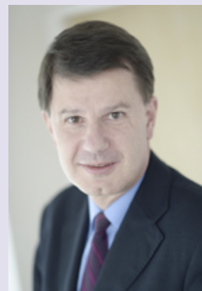
Benoît de Juvigny, Secrétaire général de l'Autorité des marchés financiers

Nous en sommes convaincus : pour protéger les particuliers des agissements de sociétés peu scrupuleuses, la prévention reste l'arme la plus efficace. C'est pourquoi l'AMF lance une campagne de communication sur internet pour sensibiliser les internautes aux dangers du Forex (lire ci-dessous).