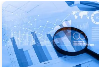
TABLEAU DES INVESTISSEURS PARTICULIERS