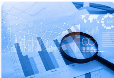
TABLEAU DES INVESTISSEURS PARTICULIERS