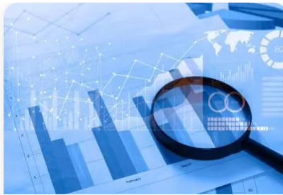
TABLEAU DES INVESTISSEURS PARTICULIERS